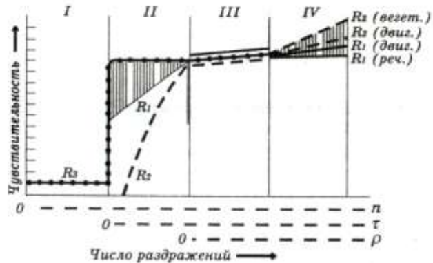
Рис. 2. Схема изменений, определяемая по разным реакциям чувствительности анализатора в зависимости от общего числа наносимых раздражителей — n , раздражителей, являющихся сигналами определенных ответных реакций, — г и числа неподкрепляемых (дифференцировочных) раздражителей — р . R_1 — реакции, обусловленные речевой инструкцией испытуемому: R_1 реч.— словесный ответ (типа «Вижу», «Слышу»...); R_1 двиг.— произвольная условная двигательная реакция. R_2 — условно-рефлекторные реакции, вырабатываемые при безусловном подкреплении: R_2 двиг.— условные мигательные; R_2 вегет.— условные кожно-гальванические. R_3 — реакции, возникающие без специальной выработки и речевых инструкций. Область расхождения порогов произвольных и словесной реакций заштрихована. I—IV — стадии изменения чувствительности. Переход от I стадии ко II соответствует приобретению раздражителем значения условного сигнала реакций R_1 или R_2 . Ось ординат — чувствительность в условных единицах; ось абсцисс — число n , г , р .

На следующей, третьей стадии происходит упрочение и дифференцирование выработанных условных рефлексов. В силу этого ориентировочные реакции сохранены. Пороги всех реакций практически совпадают. Когда условные реакции упрочены (IV стадия), произвольные ориентировочные реакции угасают. Если о чувствительности анализатора судить только по ним, может показаться, что она резко снизилась. Однако пороги ощущения ( R_1 , реч.) остаются на прежнем уровне, пороги произвольных условных двигательных реакций ( R_1 , двиг.) даже несколько снижаются, т. е. при автоматизации обусловленного инструкцией ответного движения, например нажатия рукой на кнопку, иногда появляются неосознаваемые двигательные ответы на неощущаемые раздражители. Все другие реакции показывают более высокую чувствительность анализатора: